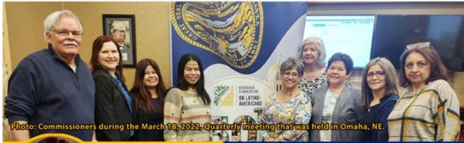
Photo: Commissioners during the March 18, 2022, Quarterly meeting that was held in Omaha, NE.